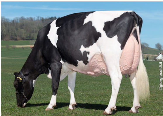
GODEL DOORMAN OKLAVE THIRD DAM