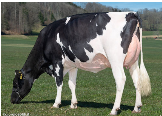
GODEL CASPER TABASCA DAM