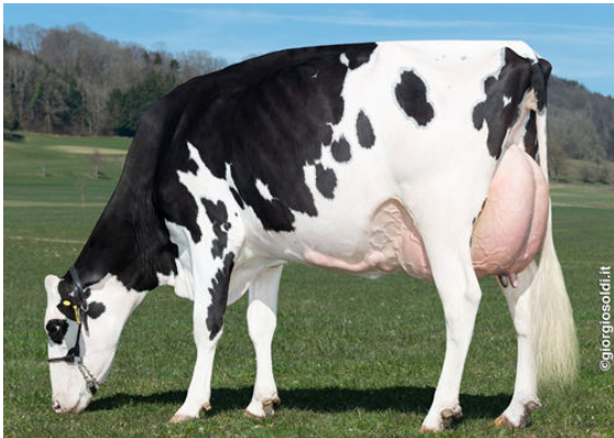
GODEL BREWMASTER SURPRISE GRANDDAM